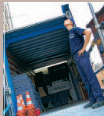
6 UN ORDRE IMPECCABLE