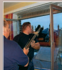
4 EN RYTHME ET EN ÉQUIPE