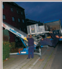
1 MISE EN PLACE ET CONTREPOIS