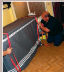
2 LE NOEUD DU DÉMÉNAGEUR