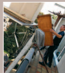
8 FORCE, DEXTERITÉ ET RESPECT DE L'OBJET