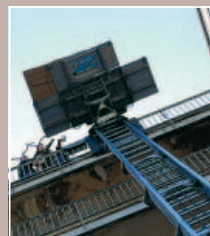
7 TOUJOURS PLUS HAUT