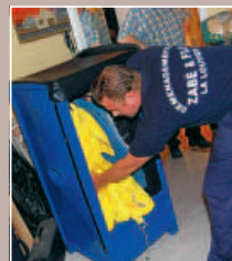
3 LES VÊTEMENTS DANS LA PENDERIE